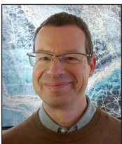
Le photographe Olivier Micheli